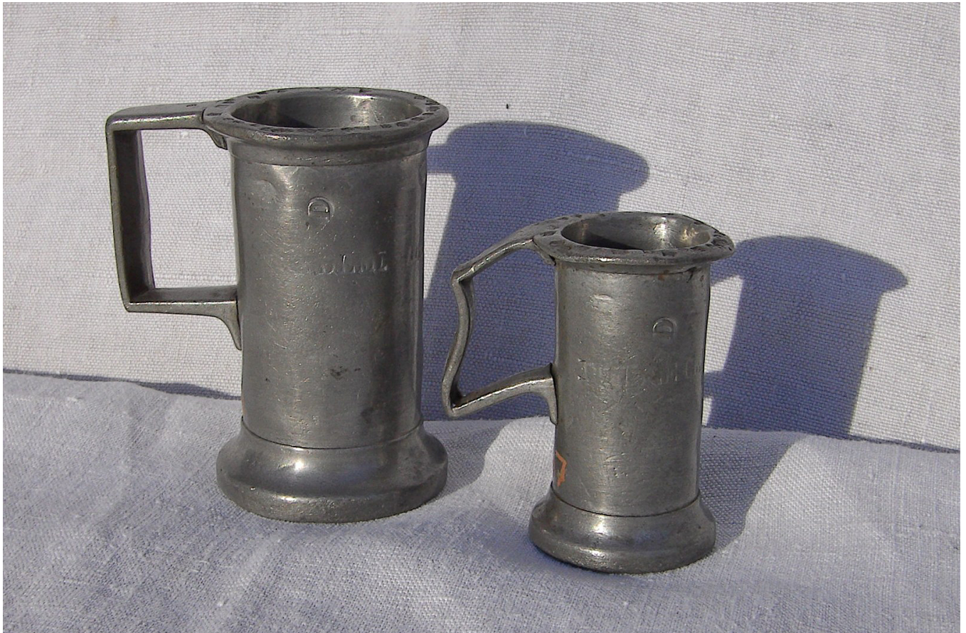
Zinnmaße 1851 –Eichmarken auf dem oberen Rand (Stadtmuseum Schrobenhausen)

Schrobenhausen, Rain am Lech, Mühlried, Pfaffenhofen: Vier Orte, die man als beispielhaft annehmen kann, haben vier verschiedenen Kornmaße: Man kann ermessen, wie schwerfällig das Wirtschaftsleben im Lande funktionierte. Bis zu einer wirkungsvollen Abhilfe dauerte es noch bis zur Reichsgründung.