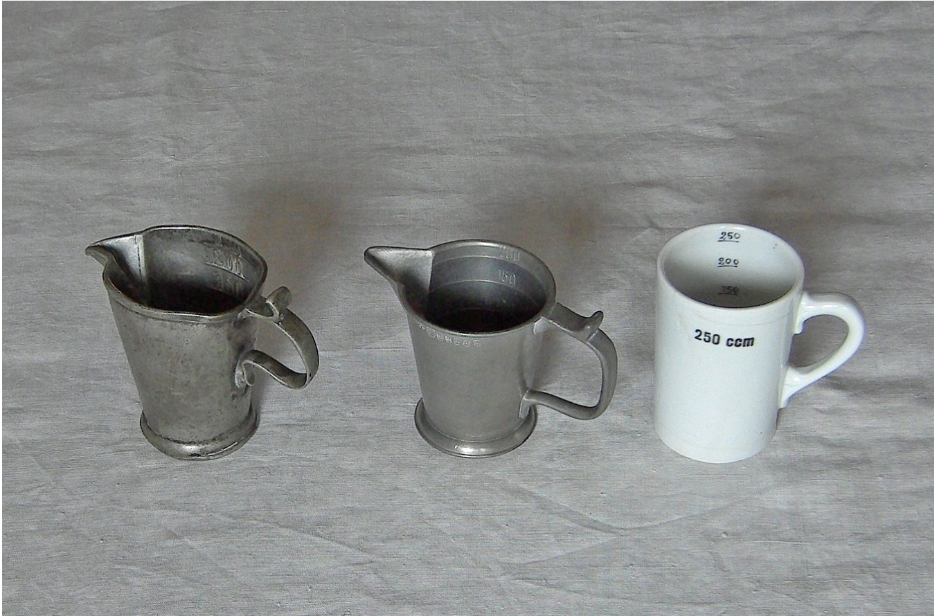
Messgefäße aus der Bachhuberschen Apotheke – metrisch mensuriert

Für den Handel mit landwirtschaftlichen Produkten und anderen Schüttgütern wie Salz oder Mehl waren eigene Hohlmaße oder Trockenmaße gebräuchlich. Hier waren die regionalen Unterschiede so beträchtlich, dass der Handel mit diesen Produkten erheblich erschwert war. Deshalb wurde bereits in der ersten Hälfte des 18. Jahrhunderts versucht, die sogenannten Getreidemaße zu vereinheitlichen.