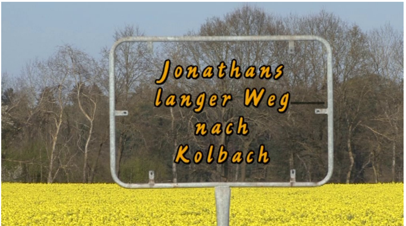
Fast fertig und dann ins Archiv: Kolbach – der letzte SOB-Film

Dieser hier unverändert wiedergegebene Text entstand im März 2013 anlässlich der Erstaufführung des SOB-Films „Lindenkeller“. Dass es die letzte Premiere einer Arbeit der SOB-Filmgruppe um Konrad Leufer werden sollte, war damals noch nicht abzusehen. Es gibt ihn zwar, den allerletzten SOB-Film „Jonathans langer Weg nach Kolbach“, fast vollendet und eigentlich ein cineastischer Leckerbissen des Amateur-Films. Doch widrige Umstände werden eine Aufführung wohl für immer verhindern. Schade!