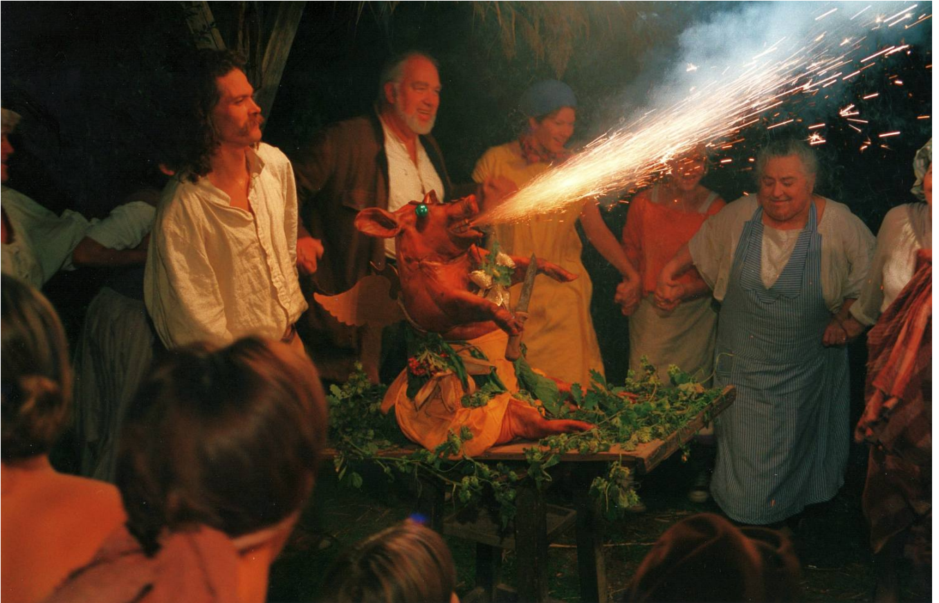
1988: Szenefoto aus dem Spielfilm „Des Tages Nacht“