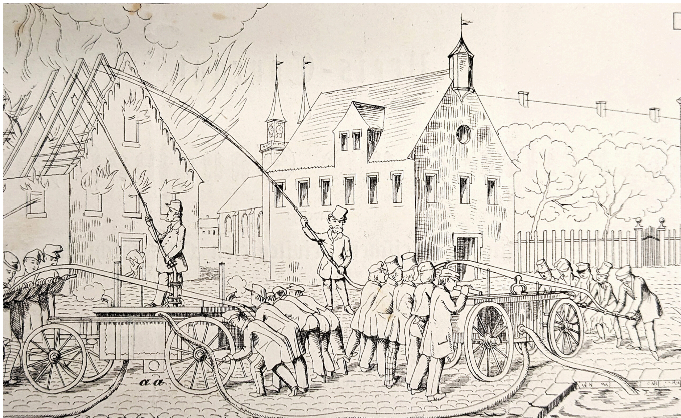
Löschsituation mit Saugspritze – aus einem Werbeblatt der Löschmaschinen-Fabrik Georg Friedrich Kübel in Bayreuth 1853