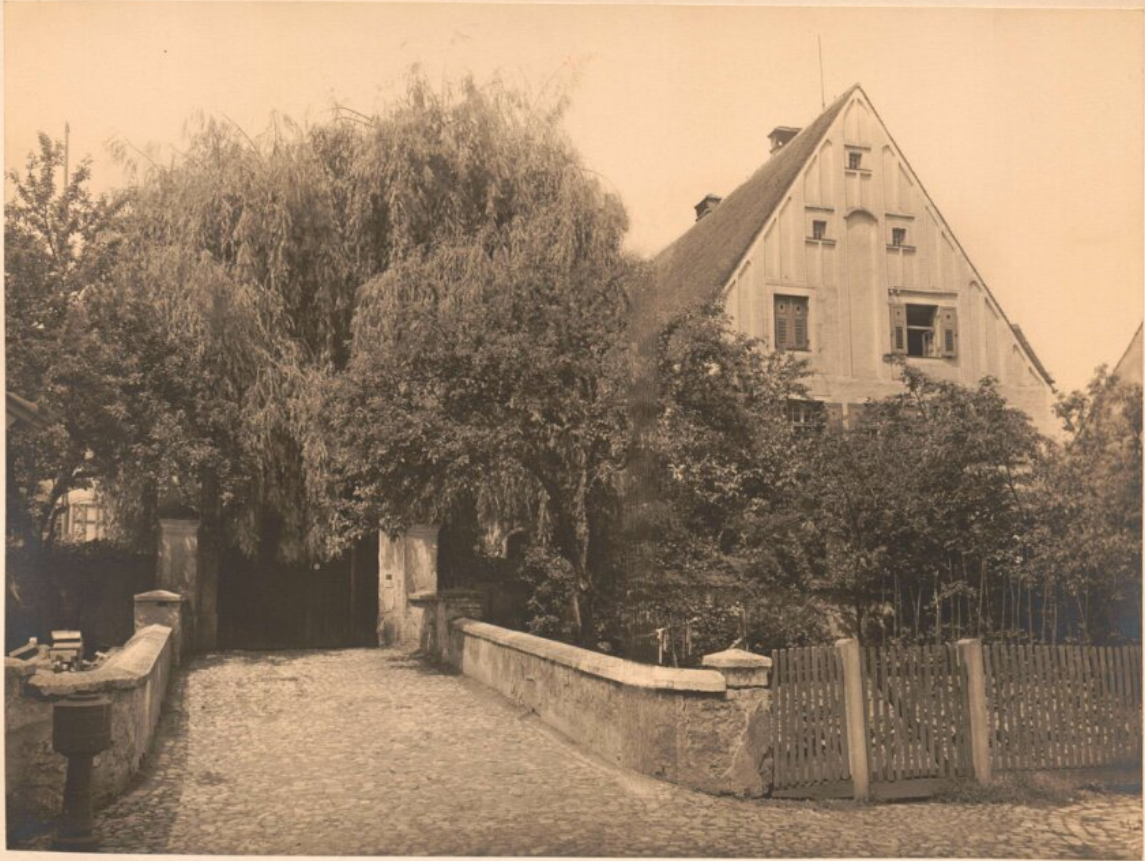
Gingang zum Bezirksamt