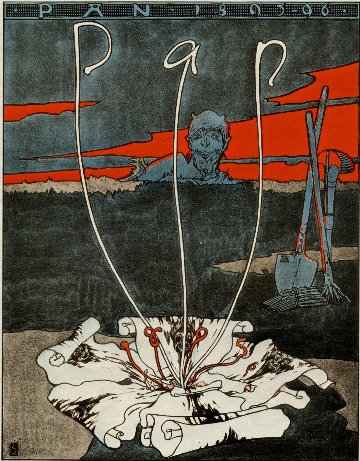
Joseph Sattler, Plakat für die Kunstzeitschrift „Pan“ 1895

»Den bedeutendsten Auftrag seines Lebens« erhält Sattler im Jahre 1898. 15 Er wird in