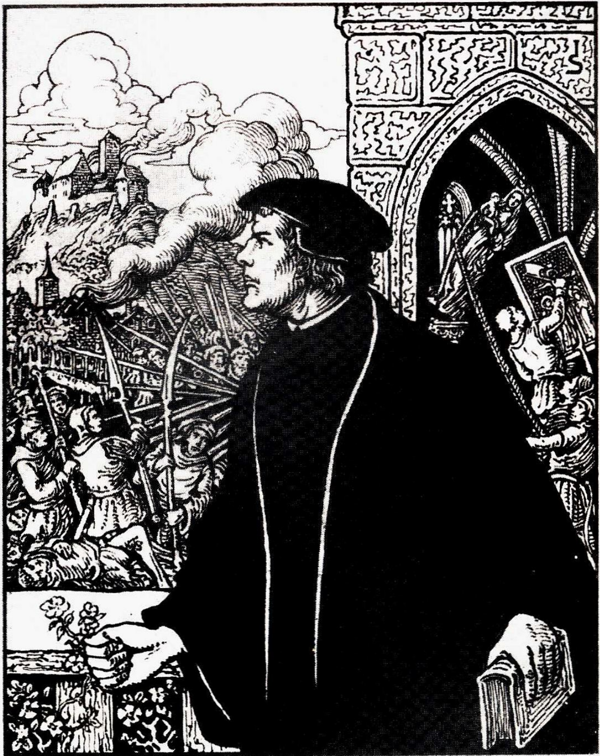
Josef Sattler, Radierung, 14,5 x 9,5 cm. Aus: Zehn Bilder aus Doctor Martin Luthers Leben, 1929