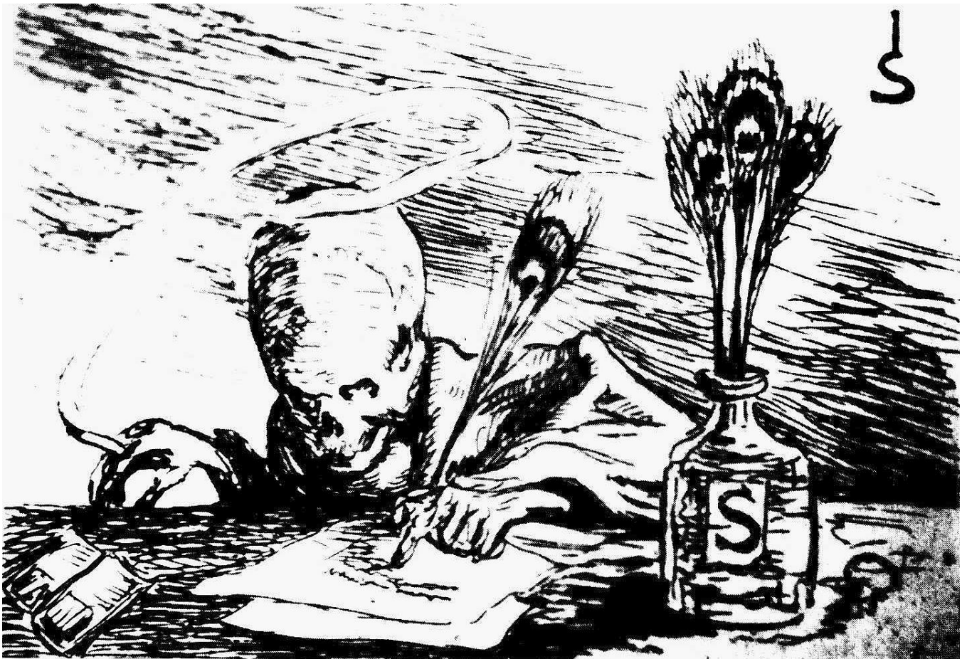
Josef Sattlers „erste Radierung“: Der Tod schreibt mit der linken Hand. Entstandem ca. 1924 in München

die Schwester erklärte, es gehe ihrem Bruder nicht gut. Am nächsten Tag, als Graf wieder kam, war Sattler bereits ins Schwabinger Krankenhaus eingeliefert worden. Auch dort besuchte der Drucker den Künstler und brachte einen neu gefertigten Druck mit. Sattler betrachtete die Arbeit und lobte sie, doch Graf hatte bemerkt, daß der Kranke das Blatt verkehrt gehalten hatte. Im nächsten Moment wollte Sattler mit Graf den Raum verlassen: >Gehn wir in die Werkstatt<, sagte der Kranke und stand auf, suchte seinen Kragen, griff nach dem Kragenknöpferl und langte, ohne dies zu bemerken, in die Zuckerdose. >Da war mir klar, wie schlimm es mit ihm stand<, sagt Graf dazu. Am nächsten Tag wollte er noch einen Besuch im Krankenhaus machen, doch er kam zu spät. Sattler war kurze Zeit vorher gestorben.« 24