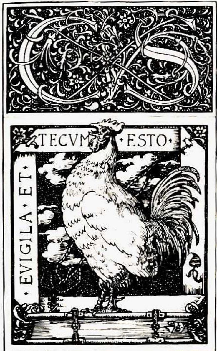
Joseph Sattler, Exlibris, Zeichnung/Kunstdruck, 6 x 9 cm. Aus: „Deutsche Kleinkunst in 42 Bücherzeichen“ 1895

Besondere Anerkennung erwarb sich Sattler bei seinen Zeitgenossen mit seinen Exlibris. Die »Zeitschrift des Ex-libris-Vereins zu Berlin« stellt – besonders in den Jahren 1893 bis 1906 – immer wieder Sattlers neue Buchzeichen vor und bespricht sie meist mit ausgesprochener Euphorie, diese »genialen Kompositionen des jungen Meisters«. 35 »In eleganter Mappe«, für 40 Mark, erscheint 1895 bei J. A. Stargardt »Deutsche Kleinkunst in 42 Bücherzeichen«. 36 Noch im gleichen Jahr folgt die englische Ausgabe »Art in Book-Plates. Forty two original Ex-Libris designed by Joseph Sattler«. Exlibris des Künstlers sind zwischen 1898 und 1906 unter anderem in London, Straßburg, Wien, Berlin und München zu sehen. 37 Die Bücherzeichen-Kundschaft Sattlers rekrutiert sich aus Hochadel, Adel und Geldadel, Bürgern und Künstlern. Vertreten sind beispielsweise auch »Ihre Majestät die Kaiserin und Königin Auguste