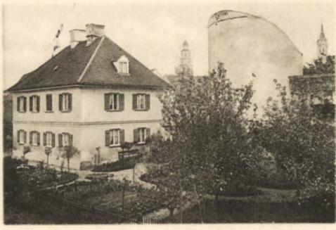
Gruss von Schrobenhausen