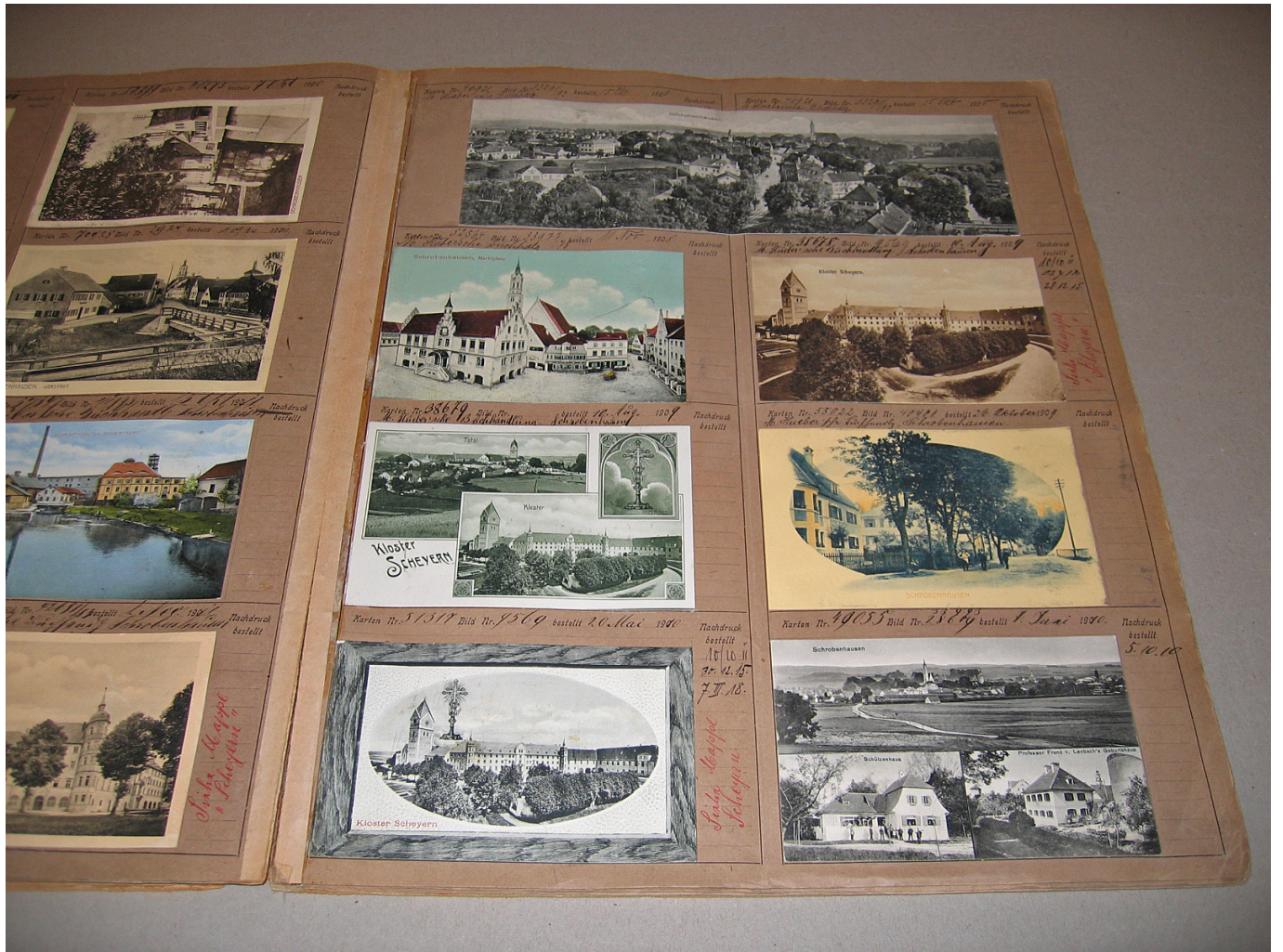
Ansichtskartenbuch der Firma Metz, Tübingen, für die Stadt Schrobenhausen. Die Seiten zeigen Karten aus den Jahren 1909 bis 1910. Wohl aus Versehen eingeklebt sind hier auch Karten von Kloster Scheyern. Einträge gibt es über Nachdrucke, über den Auftraggeber (hier meist die Hueber'sche Buchhandlung in Schrobenhausen), später auch über die Auflagenhöhe. Dieses unschätzbare Buch wurde vor vielen Jahren vom Stadtarchiv Schrobenhausen angekauft.