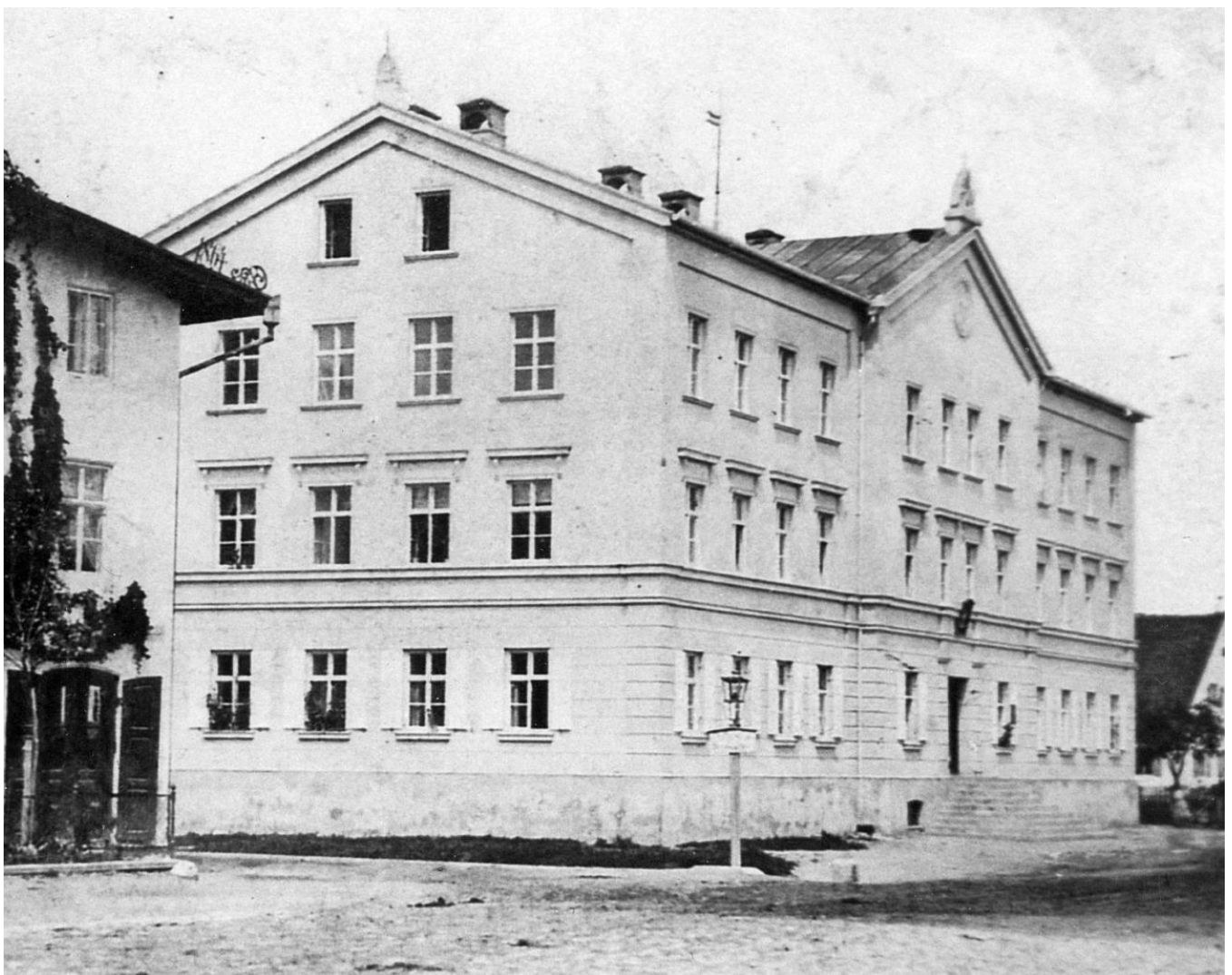
Das städtische Armenhaus, später Knabenschule, heute Verwaltungsgebäude Regensburger Str. 5, in einer historischen Aufnahme (Sammlung Peter Pfitzner)

zu erhöhen: Es erhielt die heutige äußere Form. Die Baumaßnahmen wurden 1890 abgeschlossen, man konnte durch den Umbau drei zusätzliche Unterrichtsräume gewinnen. Doch auch diese Erweiterung reichte nicht lange aus: So wurden bereits im Jahr 1906 Unterrichtsräume in das Armenhaus (das heutige Verwaltungsgebäude Regensburger Str. 5) ausgelagert. Immer mehr Unterrichtsräume entstanden nun hier, so dass nach dem Ende des Ersten Weltkriegs die Knabenschule ganz ins Armenhaus verlegt wurde und 1921 die neu gegründete Landwirtschaftsschule ins ehemalige Knabenschulhaus einzog. Einzelne Räume wurden aber – bei Bedarf – immer wieder anderen Schrobenhausener Schulen überlassen, so der Knabenschule, der Berufsschule, später auch der 1938 gegründete Oberschule, das spätere Gymnasium. Unmittelbar nach Kriegsende waren amerikanische Soldaten im Schulgebäude einquartiert.